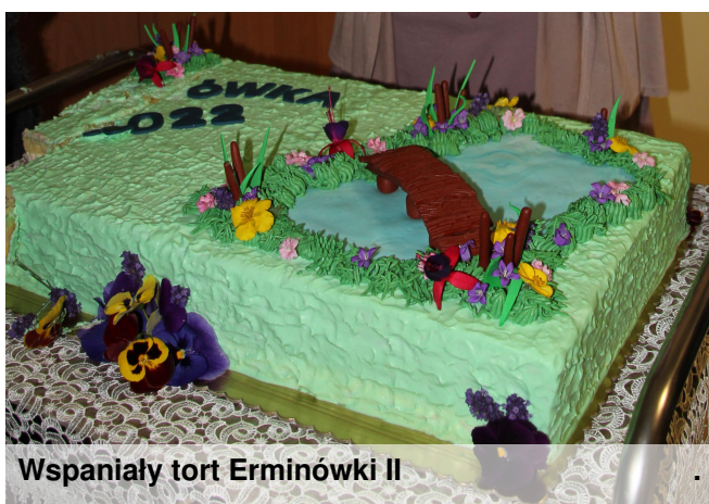
Wspaniały tort Erminówki II