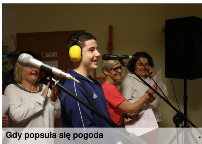
Gdy popsza się pogoda